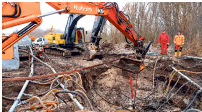
Um an der havarierten Stelle überhaupt arbeiten zu können, musste vor Ort das Grundwasser abgesenkt werden.

Umgehend setzt WAL-Betrieb seinen Notfallplan in Kraft. Das bedeutet als allererstes, das Hauptpumpwerk außer Betrieb zu nehmen, um den Abfluss