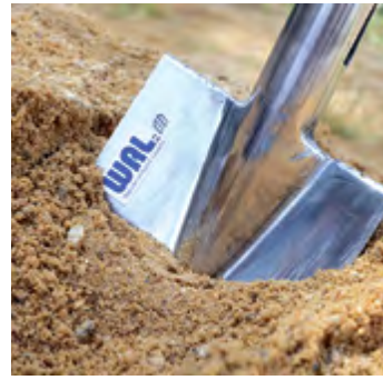
Das Jahr 2025 war geprägt von ersten Spatenstichen für die WAL-Projekte im Trinkwasserverbund „Lausitzer Revier“.

In der Tagung der WAL-Verbandsversammlung am 2. Juli steht der Jahresabschluss 2025 im Mittelunkt. Die Vorzeichen für die Zusammenkunft des regionalen „Wasserparlaments“ sind überaus positiv.