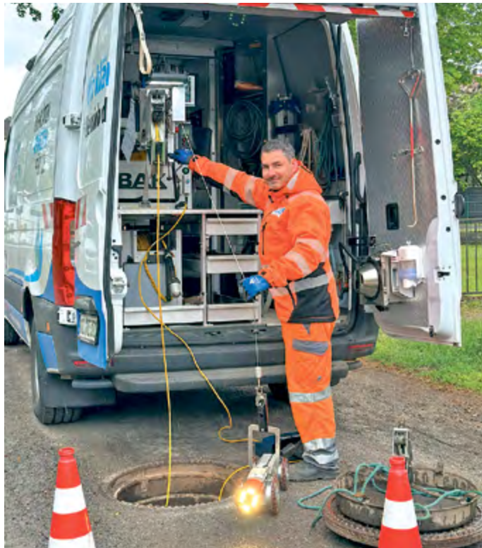
Der kleine TV-Wagen wird in den Kanal hinabgelassen.

Die regelmäßige Befahrung der Abwasserkanäle dient dazu,