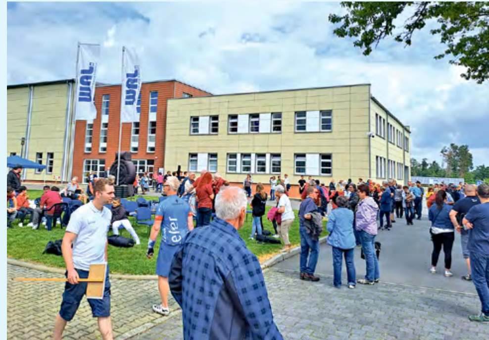
Das Wasserwerk Tettau gehört zu den größten Produktionsstätten des Lebensmittels Nr. 1 im Land Brandenburg, sowohl heute als auch für künftige Generationen. Die „Weberknechte“ (Bild rechts) aus Finsterwalde sorgen rhythmisch für Stimmung. Wenn das kein Grund zum Feiern ist!

Behördliche Entscheidungen rund um die Versorgung mit Trinkwasser bieten den Kundinnen und Kunden des WAL auf den ersten Blick wenig Spannendes. Doch dahinter steckt im aktuellen Fall nicht mehr und nicht weniger als langfristige Sicherheit. Und auch das können wir am 4. Juli im Wasserwerk Tettau gemeinsam feiern.